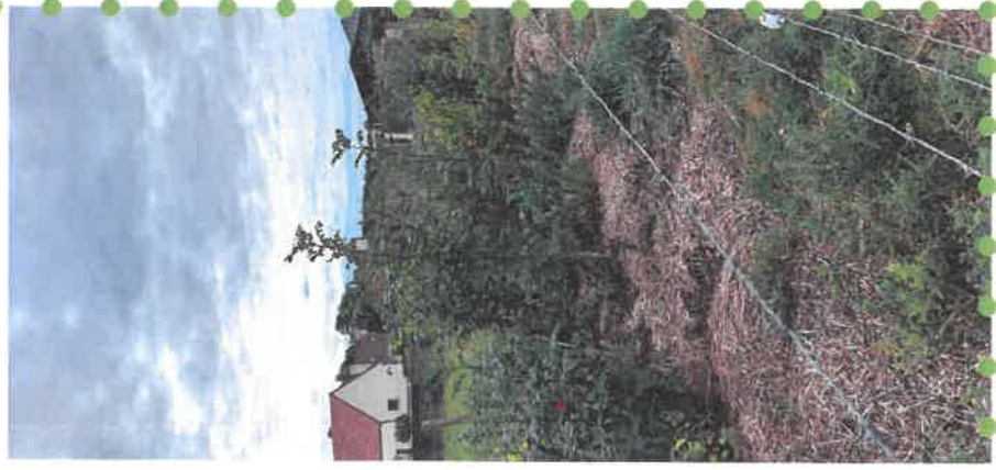
Quelques photos des exploitations candidates du concours de 2022 - 2023